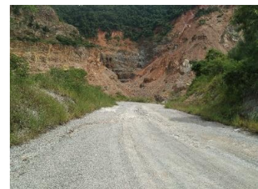
เส้นทางขนส่งแร่ระหว่างหน้าเหมือง-โรงโม่หิน