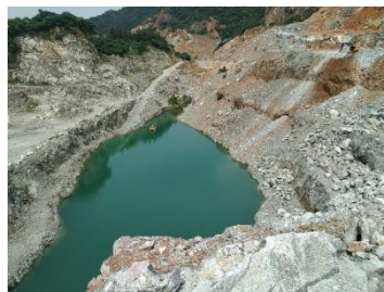
บ่อเหมือง (Sump)