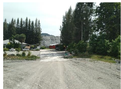
เส้นทางเข้าสู่พื้นที่โครงการ