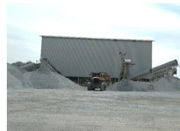
พื้นที่โรงโม่หินของโครงการ