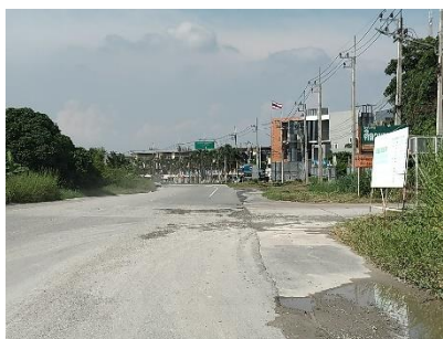
ทางหลวงหมายเลข 3144